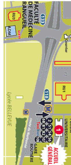
La partie à pied